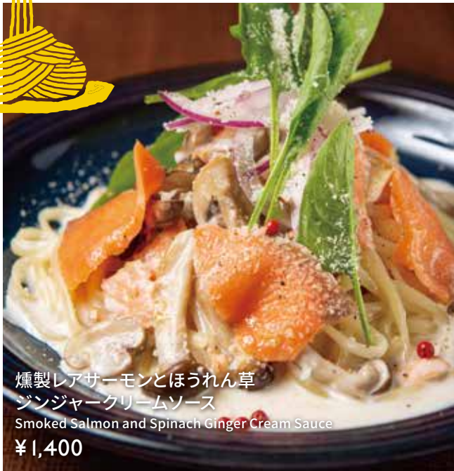
燻製レアサーモンとほうれん草 ジンジャークリームソース Smoked Salmon and Spinach Ginger Cream Sauce ¥1,400