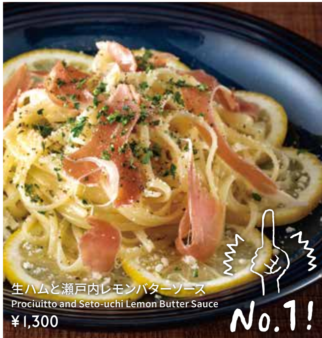
生ハムと瀬戸内レモンバターソース Prociutto and Seto-uchi Lemon Butter Sauce ¥1,300