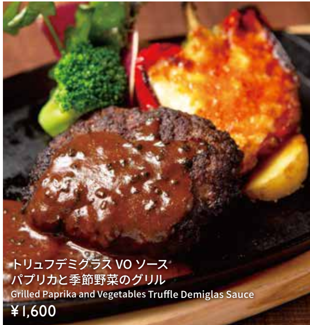
トリュフデミグラス VO ソース パプリカと季節野菜のグリル Grilled Paprika and Vegetables Truffle Demiglas Sauce ¥1,600