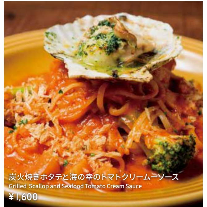
炭火焼きホタテと海の幸のトマトクリームソース Grilled Scallop and Seafood Tomato Cream Sauce ¥1,600