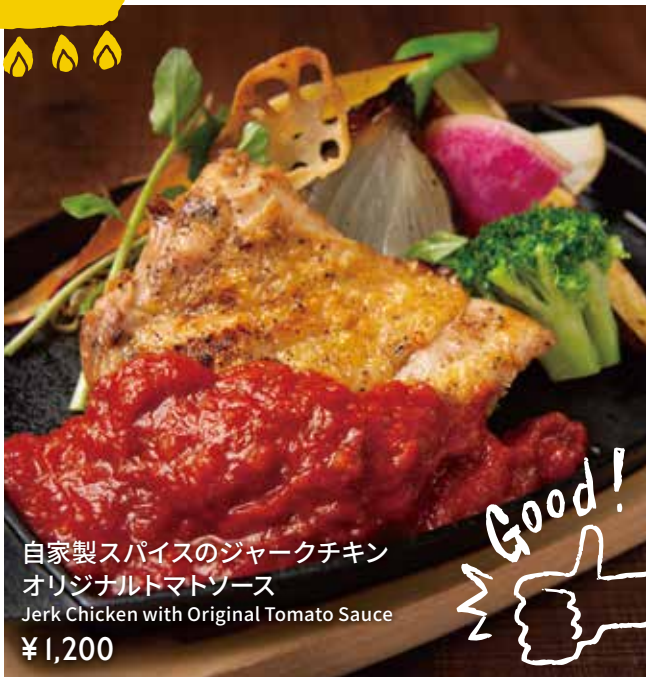
自家製スパイスのジャークチキン オリジナルトマトソース Jerk Chicken with Original Tomato Sauce ¥1,200