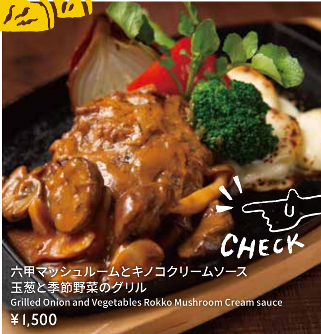
六甲マッシュルームとキノコクリームソース 玉葱と季節野菜のグリル Grilled Onion and Vegetables Rokko Mushroom Cream sauce ¥1,500