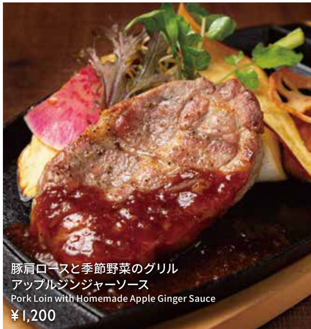
豚肩ロースと季節野菜のグリル アップルジンジャーソース Pork Loin with Homemade Apple Ginger Sauce ¥1,200