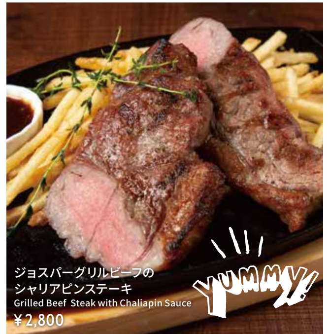
ジョスパークリルビーフの シャリアピンステーキ Grilled Beef Steak with Chaliapin Sauce ¥2,800