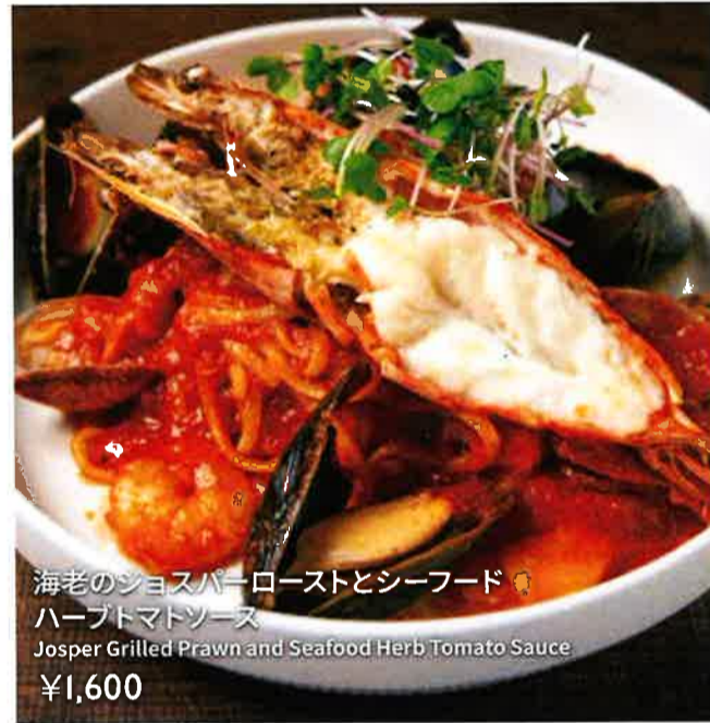
海老のジョスパーローストとシーフード ハーブトマトソース Josper Grilled Prawn and Seafood Herb Tomato Sauce ¥1,600