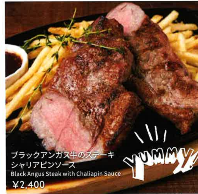
ブラックアンガス牛のステーキ シャリアピンソース Black Angus Steak with Chaliapin Sauce ¥2,400