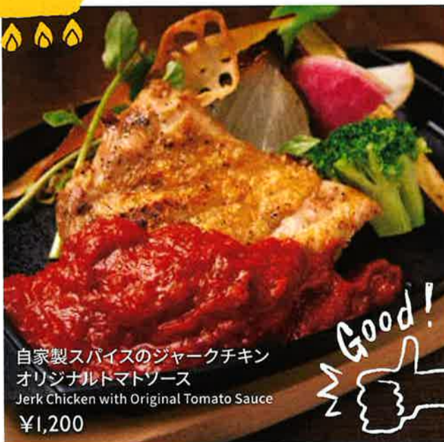
自家製スパイスのジャークチキン オリジナルトマトソース Jerk Chicken with Original Tomato Sauce ¥1,200