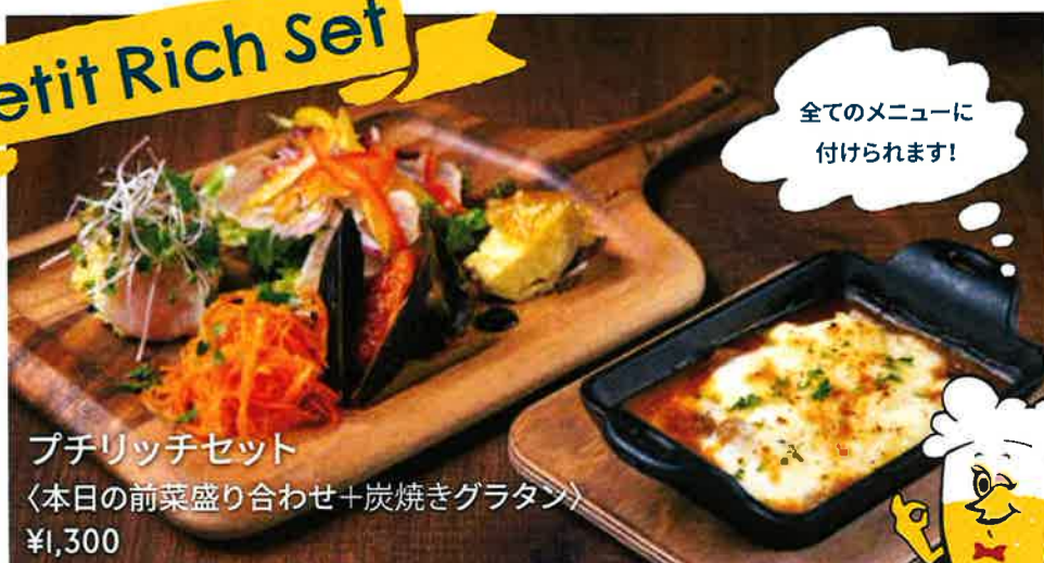
プチリッチセット 〈本日の前菜盛り合わせ+炭焼きグラタン〉 ¥1,300