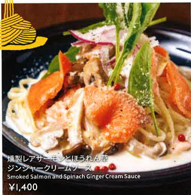
燻製レアサーモンとほうれん草 ジンジャークリームソース Smoked Salmon and Spinach Ginger Cream Sauce ¥1,400