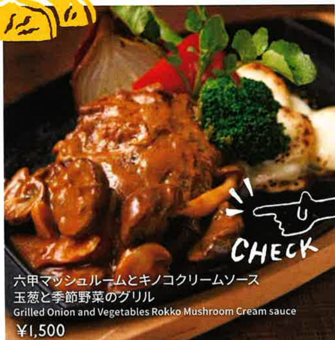
六甲マッシュルームとキノコクリームソース 玉葱と季節野菜のグリル Grilled Onion and Vegetables Rokko Mushroom Cream sauce ¥1,500