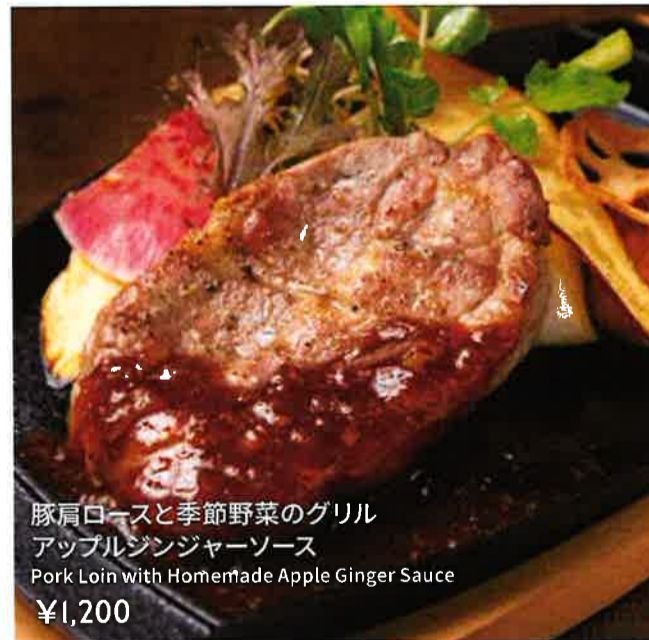
豚肩ロースと季節野菜のグリル アップルジンジャーソース Pork Loin with Homemade Apple Ginger Sauce ¥1,200