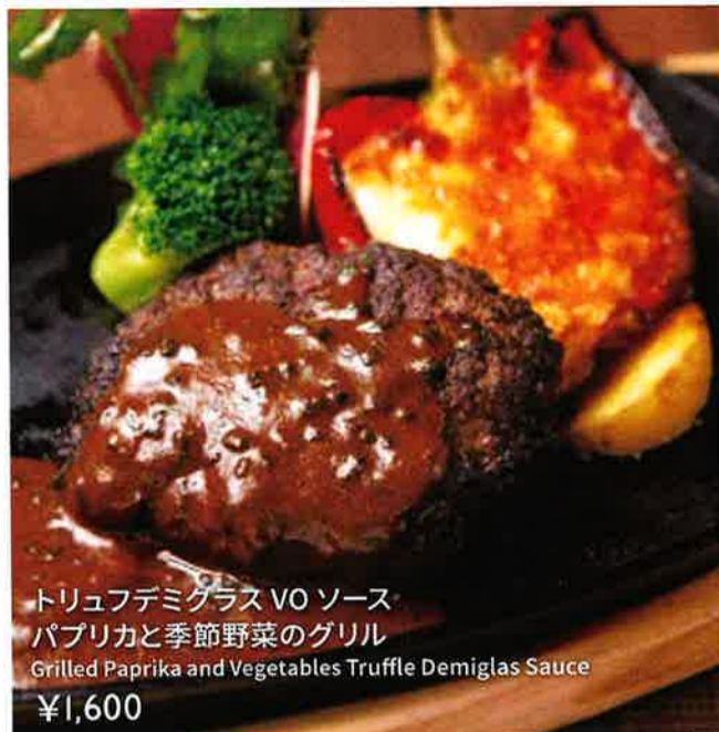
トリュフデミグラスVOソース パプリカと季節野菜のグリル Grilled Paprika and Vegetables Truffle Demiglas Sauce ¥1,600