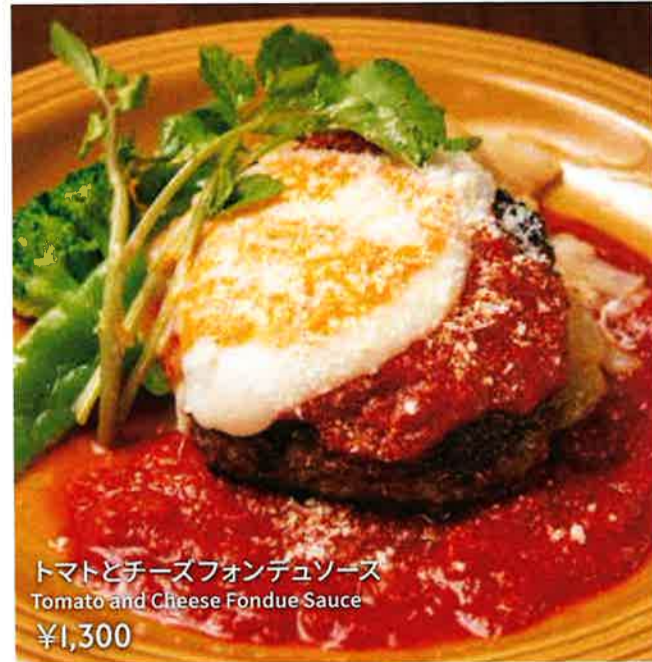
トマトとチーズフォンデュソース Tomato and Cheese Fondue Sauce ¥1,300