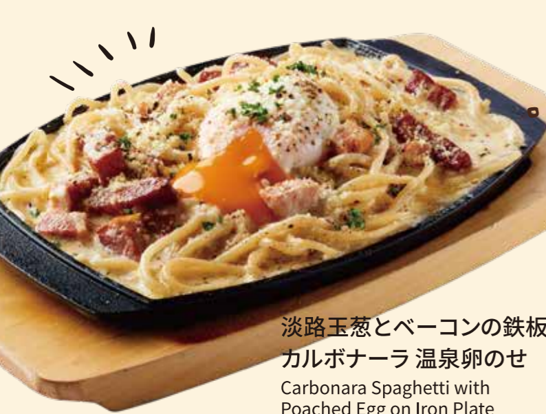
淡路玉葱とベーコンの鉄板 カルボナーラ 温泉卵のせ Carbonara Spaghetti with Poached Egg on Iron Plate ¥ 1,280