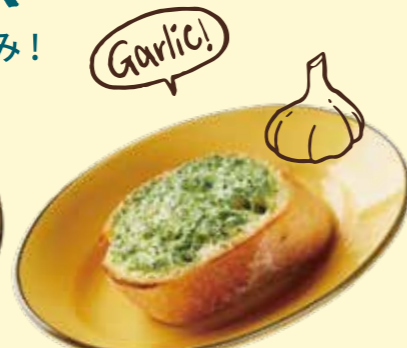
ガーリック ジョスパートースト Garlic Josper Toast ¥ 160