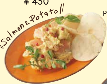
スモークサーモンの スパイシーポテサラ Smoke Salmon Spicy Potato Salad ¥ 480