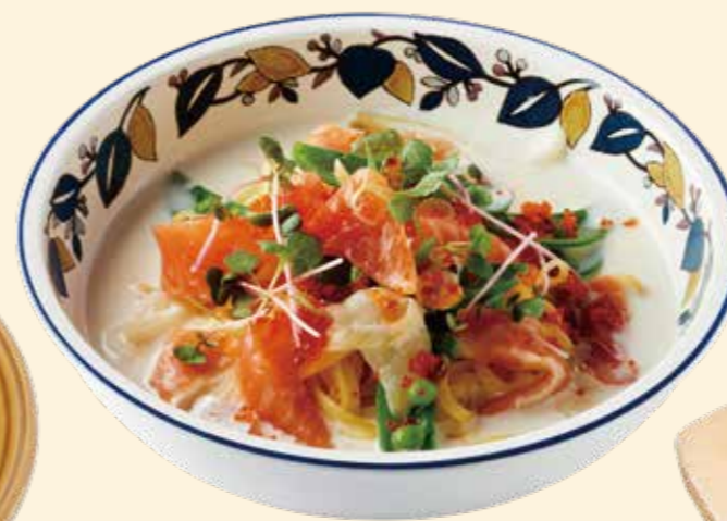
レアサーモンとイクラのクリームソースの 生パスタ 大葉のベビーリーフ乗せ Raw Salmon and Salmon Roe Cream Fresh Pasta with Baby Shiso Leaf ¥ 1,380