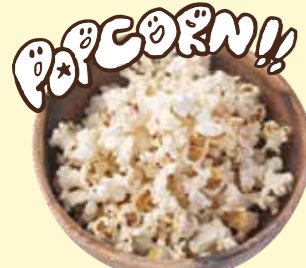
ポップコーン Popcorn ¥ 100