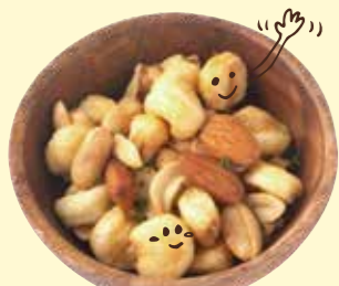
ミックスナッツ Mix Nuts ¥ 450