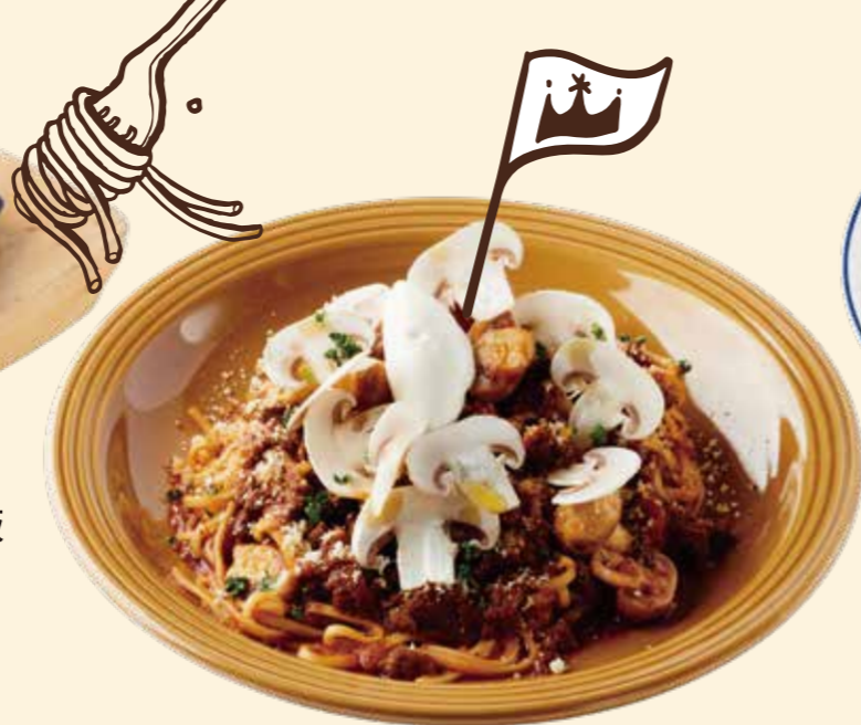
フレッシュ六甲マッシュルームと自家製 ミートソースの生パスタマスカルポーネチーズ Homemade Meat Sauce pasta with Fresh Rokko Mushroom and Mascarpone Cheese ¥ 1,330