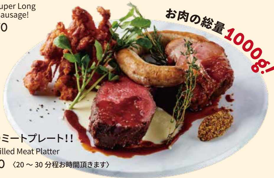
メガ盛りミートプレート!! Special Grilled Meat Platter ¥ 5,680 <20 ~ 30 分程お時間頂きます>