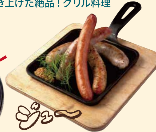
グリルソーセージ 4 種盛合わせ Grilled Sausage Platter ¥ 1,480