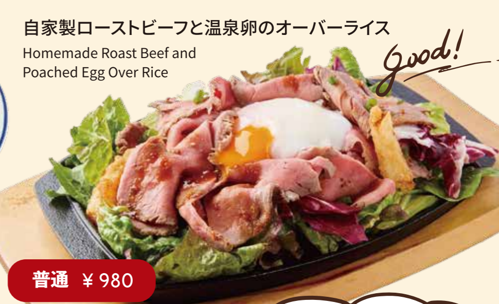
自家製ローストビーフと温泉卵のオーバーライス Homemade Roast Beef and Poached Egg Over Rice