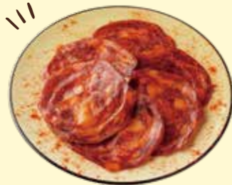
スペイン産ピリ辛サラミ チョリソー Spicy Chorizo Sausage ¥ 450