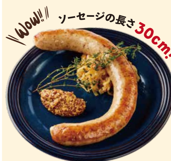
生ポークロングソーセージ 30cm! Super Long Grilled Sausage! ¥ 1,070