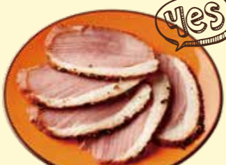
鴨胸肉のペッパーズモーク パストラミ Pepper Smoked Duck Pastrami ¥ 480