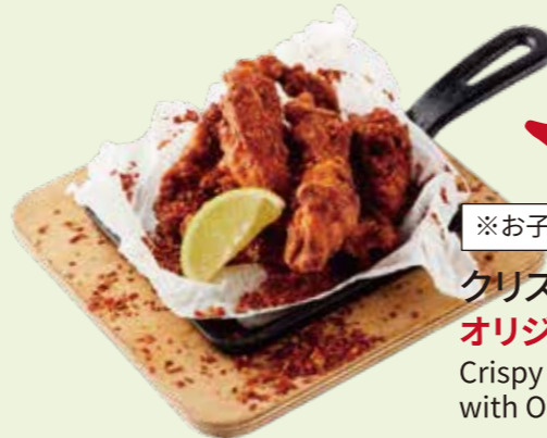
※お子様はご注意ください クリスピービアチキン オリジナルクレイジーホット! Crispy Pepper Beer Chicken with Original Crazy Hot ¥ 890