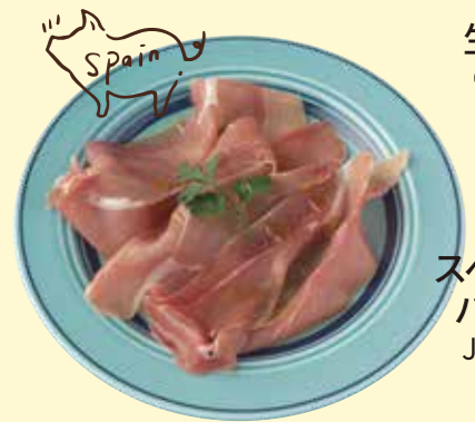
スペイン産生ハム ハモンセラノ Jamon Serrano ¥ 570