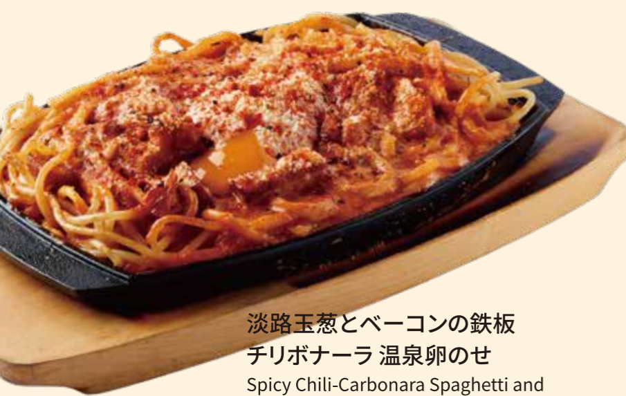
淡路玉葱とベーコンの鉄板 チリボナーラ 温泉卵のせ Spicy Chili-Carbonara Spaghetti and Poached Egg on Iron Plate ¥ 1,330