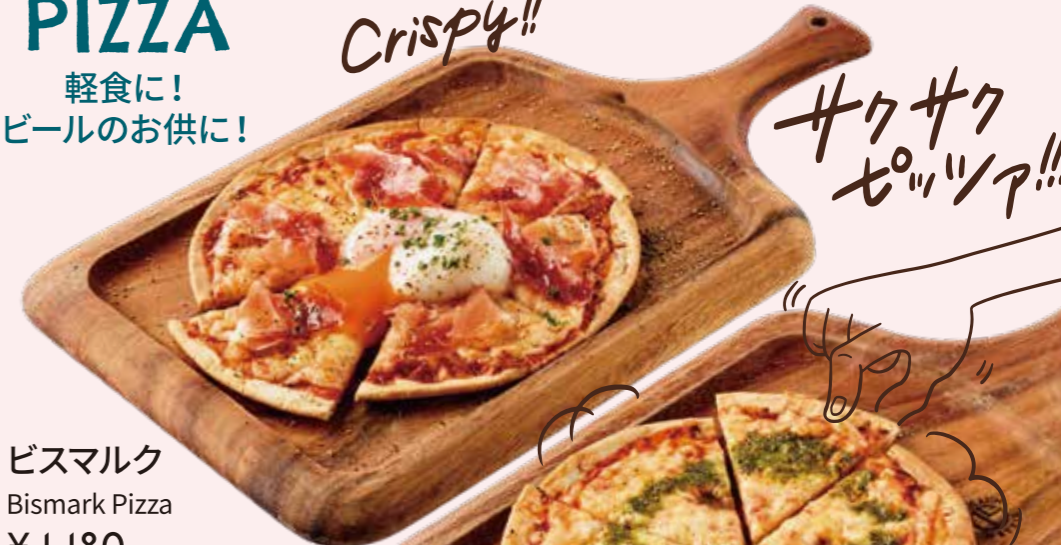
ビスマルク Bismark Pizza ¥ 1,180