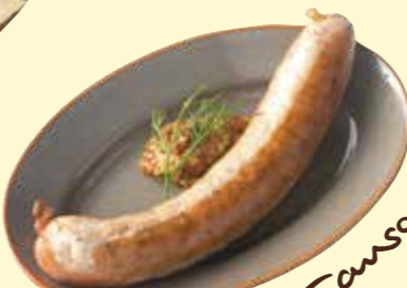
生ポークソーセージ Grilled Pork Sausage ¥ 570