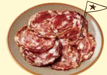
スペイン産サラミ Salami from Spain ¥ 450