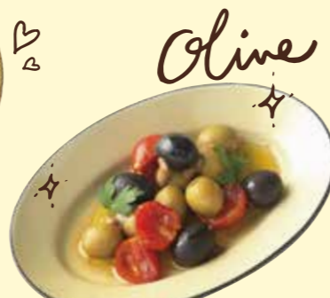
自家製ドライトマトと オリーブのアンチョビマリネ Anchovy Marinated Dried Tomato and Olives ¥ 480