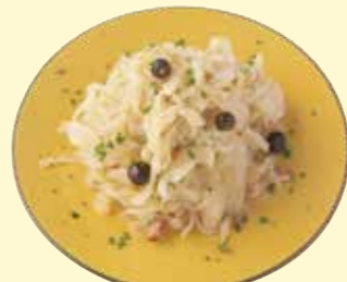
ザワークラウト Sauerkraut ¥ 380